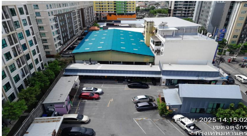
ทิศเหนือ ติดกับ โครงการ Block space พหลโยธิน 34