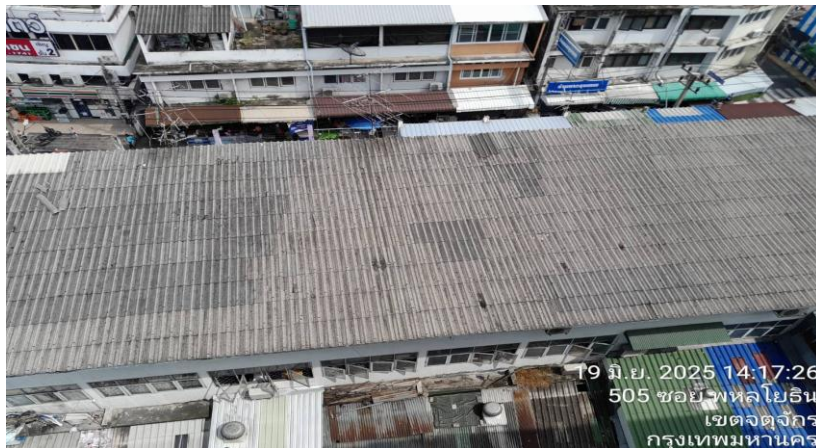
ทิศใต้ ติดกับ อาคารพาณิชย์ ขนาดความสูง 3 ชั้น