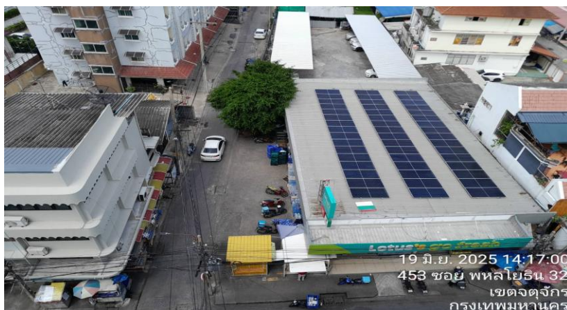
ทิศตะวันออก ติดกับ อาคารพาณิชย์ ขนาดความสูง 3 ชั้น จำนวน 4 คูหา และ LOTUS'S GO FRESH